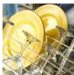
Automatsko pranje posuđa